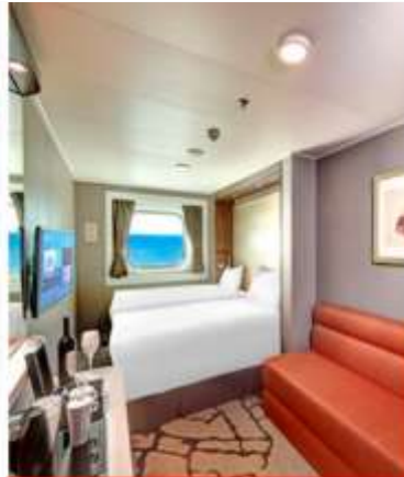
Oceanview Stateroom with Window