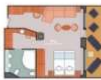
Floor Diagram Grand Suite Sleeps up to 4 10 Cabins Cabin: 498 sqft (46 m 2 ) * Size may vary, see details below.