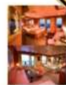
ชั้น 7 กลางเรือ