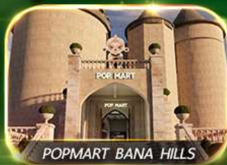
POPMART BANA HILLS

สัมผัสความงามหมู่บ้านฝรั่งเศสที่บานาฮิลล์ ช้อปปิ้ง POPMART เยือนเมืองโบราณฮอยอัน ล่องเรือกระดิง วัดหลินอึ้ง สะพานมังกร