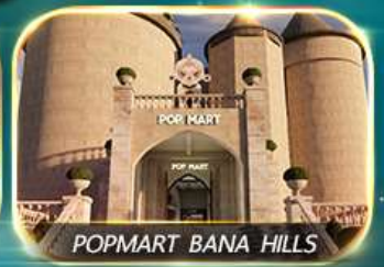
POPMART BANA HILLS

สัมผัสความงามหมู่บ้านฝรั่งเศสที่บานาฮิลล์ ช้อปปิ้ง POPMART