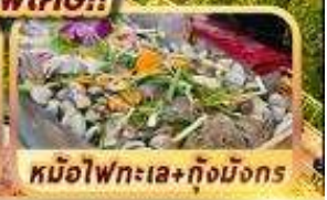
หม้อไฟทะเล+กุ้งมังกร