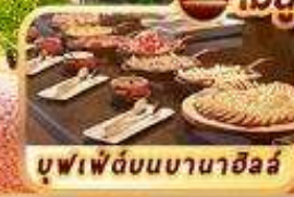
บุฟเฟ่ต์บนบานาฮิลล์