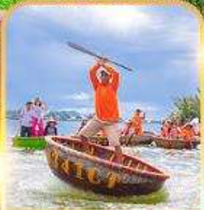
นั่งเรือกระด้ง