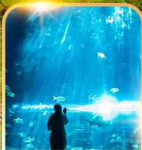
อควาเรียม