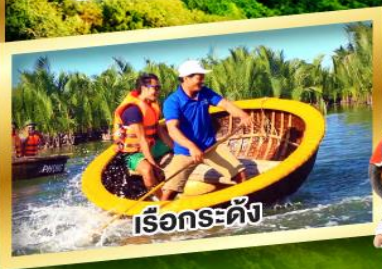
เรือกระดิ่ง