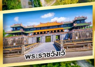
พระราชวังเว้