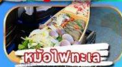
หม้อไฟทะเล