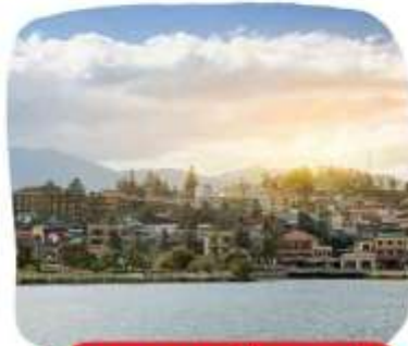
ทะเลสาบเมืองซาปา