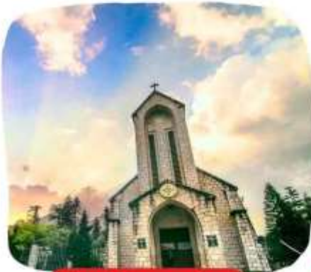
โบสถ์หินซาปา

แนะนำสถานที่ท่องเที่ยวในเมืองซาปา (ราคาทัวร์ไม่รวมค่าเดินทาง)