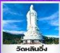
วัดหลินฮิง