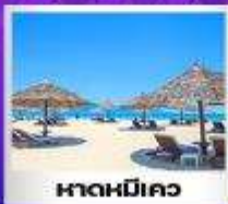
หาดหมิเคว