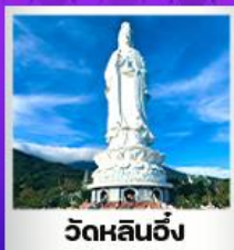
วัดหลินจิ่ง