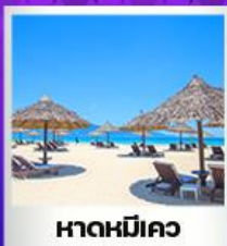
หาดหมีคว