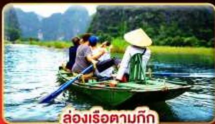
ล่องเรือตามกีก