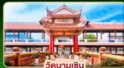
วัดนามเซิน