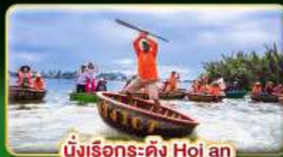
นั่งเรือระดัง Hoi an