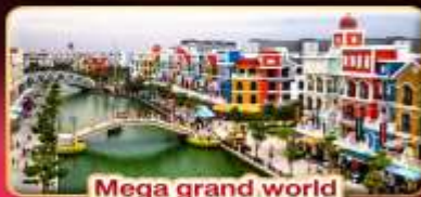
Mega grand world