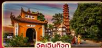
วัดเงินทิว