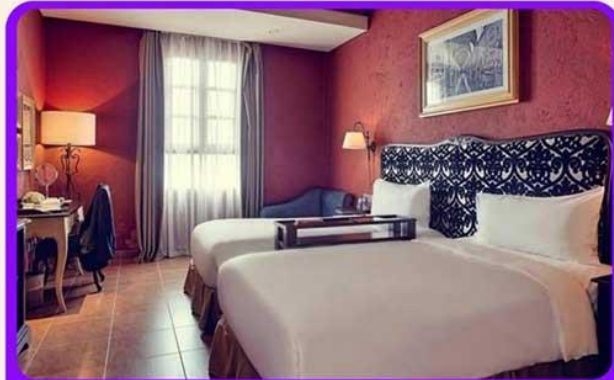
พักบนบานาฮิลล์ 1 คืน