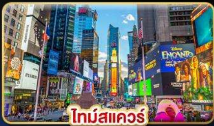
ไทม์สแควร์