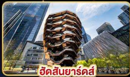
วันด์วอร์ลด์