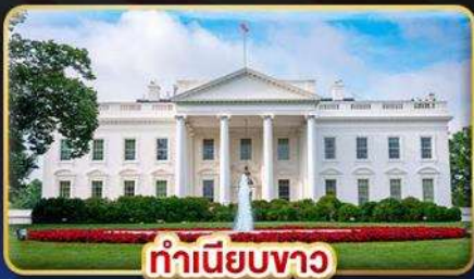
ทำเนียบขาว