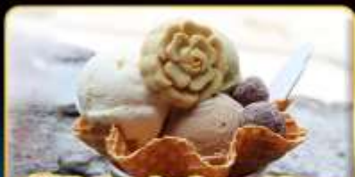
ฟรี Miyahara Ice Cream 1 Scoop

"ขอความรักวัดหลงซาน" ปล่อยคอมลอยเส้นทางรถไฟผิงซี