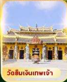
วัดฮิมเงินเทพเจ้า