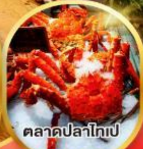
ตลาดปลาไทเป