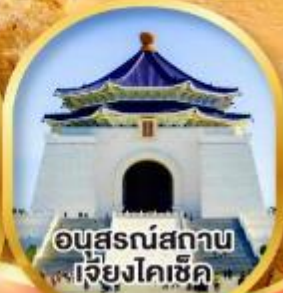
อนุสรณ์สถาน เจียงไคเช็ค