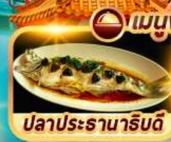
ปลาประธาราธิบดี