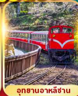
อุทยานอาหลี่ซาน