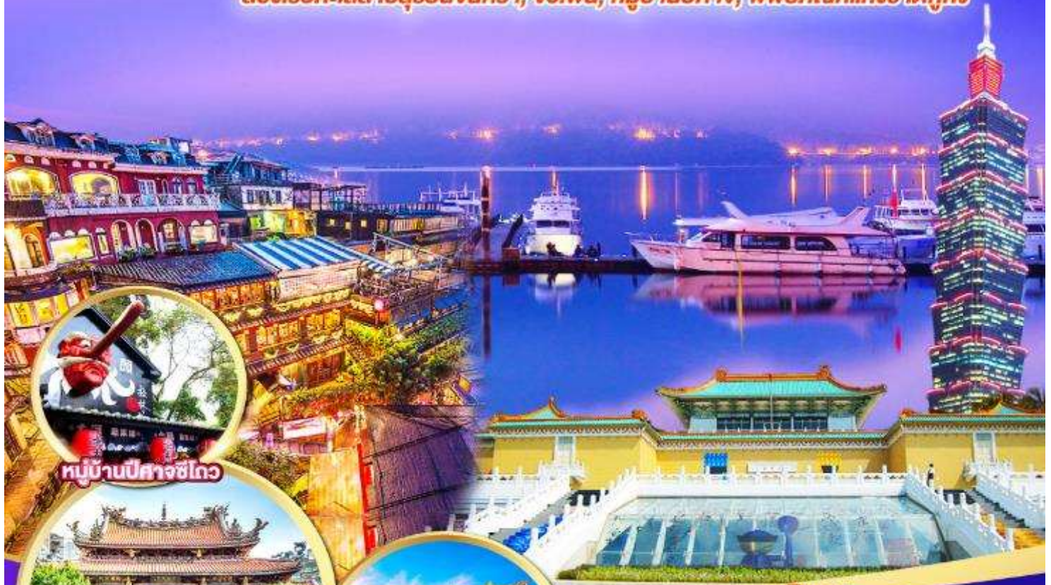
หมู่บ้านปิตาจชไต

ล่องเรือทะเลสาบสุริยันจันทรา, จิวเฟิ่น, หมู่บ้านปิตาจ, พิพิธภัณฑ์แห่งชาติกู้กง