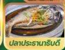
ปลาประรานาธิบดี