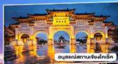
อนุสรณ์สถานเจียงไคเช็ค