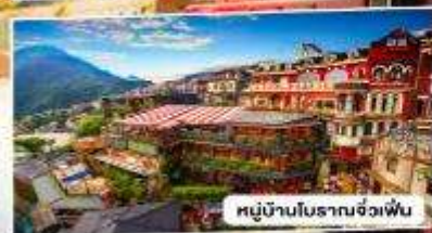
หมู่บ้านโบราณจิวเฟิ่น