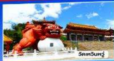
วัดเหวินหวู่

อาลีซาน ทะเลสาบสุริยันจันทรา จั๋วเฟิ่น 5วัน 3คืน