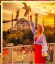
ลู่ฟือปเซเวนฮิลล์ส