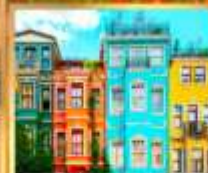
บ้านหลากสี คิสเลอร์ฟู