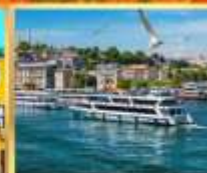
เรือเฟอร์รี่

เที่ยวครบเส้นทางยอดนิยม บินเข้าถึงเย็น เช้าชมสุเหร่ายักษ์คามลิก้า และล่องเรือเฟอร์รี่ ชมเทศกาลทิวลิปแห่งนครอิสตันบูล