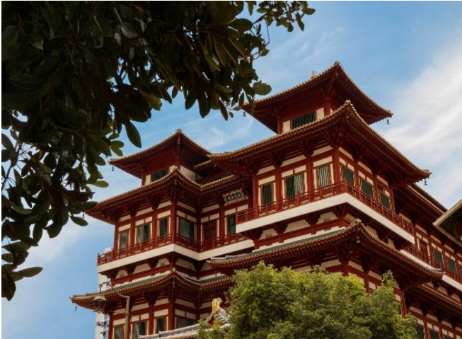
ประมาณ 1 ชม.

นำท่านเดินทางสู่ CHINATOWN ชมวัดพระเชี้ยวแก้ว (Buddha Tooth Relic Temple) สร้างขึ้นเพื่อเป็นที่ประดิษฐานพระเชี้ยวแก้ว ของพระพุทธเจ้า วัดพระพุทศศาสนาแห่งนี้สร้างสถาปัตยกรรม สมัยราชวงศ์ถัง วางศิลาฤกษ์ เมื่อวันที่ 1 มีนาคม 2005 ค่าใช้จ่ายในการก่อสร้างทั้งหมดราว 62 ล้านเหรียญสิงคโปร์ (ประมาณ 1500 ล้านบาท) ชั้นล่างเป็นห้องโถงใหญ่ใช้ประกอบศาสนพิธี ชั้น 2-3 เป็นพิพิธภัณฑ์และห้องหนังสือ ชั้น 4 เป็นที่ประดิษฐานพระเชี้ยวแก้ว (ห้ามถ่ายภาพ) ให้ท่านได้สักการะองค์เจ้าแม่กวนอิม และใกล้กันก็เป็นวัดแขกซึ่งมีศิลปกรรมการตกแต่งที่สวยงาม พร้อมเดินเล่นช้อปปิ้ง ชื่อของที่ระลึกตามอัธยาศัย