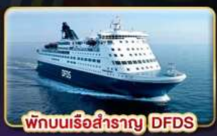
พักบนเรือสำราญ DFDS