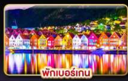
พักเบอร์เกน