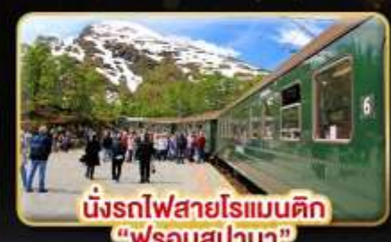
นั่งรถไฟสายโรแมนติก “ฟรอมสปาน่า”