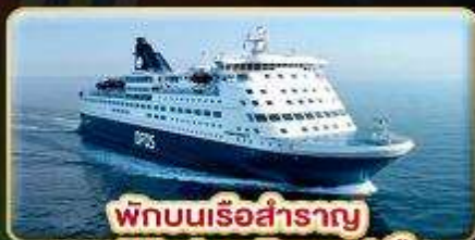
พักผ่อนเรือสำราญ แบบ Window Room 1 คืน