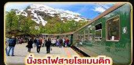
นั่งรถไฟสายโรแมนติก "ฟรอมสปาน่า"