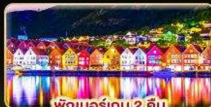
พักเบอร์เกน 2 คืน