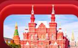
จัตุรัสแดง