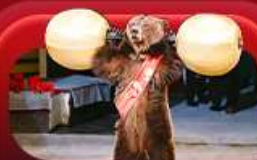
ชมละครสัตว์