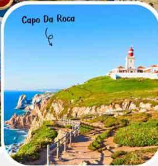
Capo Da Roca