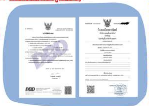
ตัวอย่างหนังสือจดทะเบียนบริษัทฯ และ ใบทะเบียนพาณิชย์