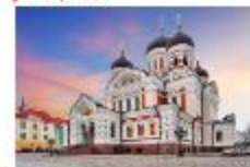
โบสถ์อเล็กซานเดอร์ เนฟสกี

19.35 น. ออกเดินทางสู่อิสตันบูล เที่ยวบิน TK1424