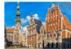
เมืองริกา

** พักที่ Bellevue Park Hotel Riga 4* หรือเทียบเท่า **