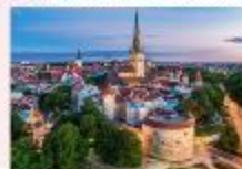
Tallinn Old Town