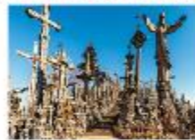
Hill of Crosses