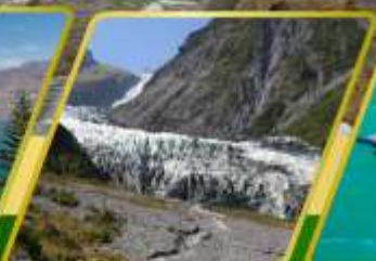
ธารน้ำแข็ง FOX GLACIER