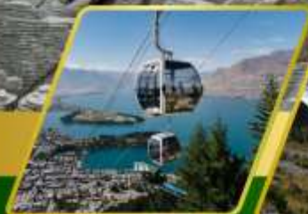
นั่งกระเช้ากอนโดล่า รับประทานอาหาร บนยอดเขากอนโดล่า