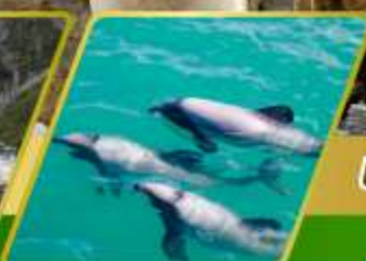
ล่องเรือชมโลมา อ่าวอาคารัว