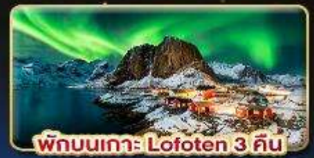
พิกนเกาะ Lofoten 3 คืน