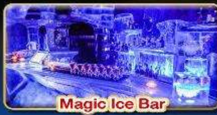
Magic Ice Bar