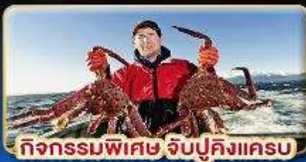
กิจกรรมพิเศษ จับปูคิงแคส