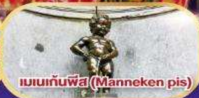
แมนกันพีส (Manneken pis)