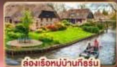
ล่องเรือหมู่บ้านกังหัน