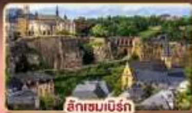
ลักเซมเบิร์ก