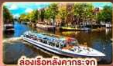
ล่องเรือหลังคากระจก