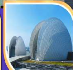
โรงละครหอยโข่งบุก