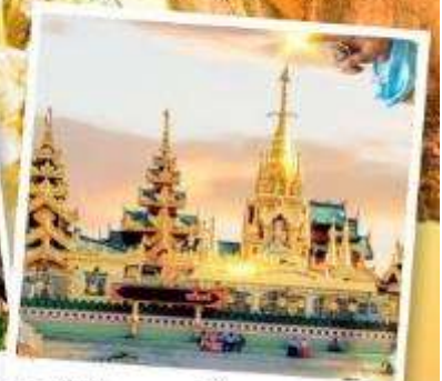
เจดีย์กลางน้ำ (สิริเยม)