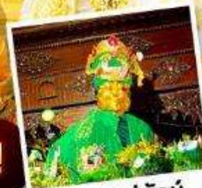
ขอพรแม่ยักย์