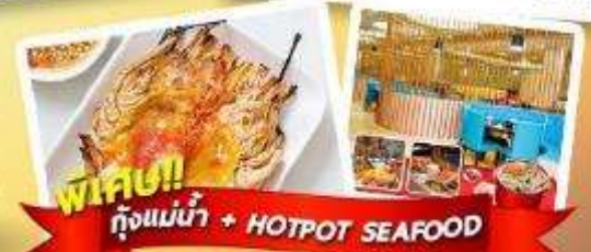
พิกัด!! กึ่งแม่น้ำ + HOTPOT SEAFOOD