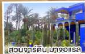
สวนจาร์ดิน|มาจออเรล

14-23 มี.ค. 68 23 เม.ย.-02 พ.ค. 68 02-11 พ.ค. 68