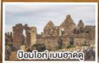
ป้อมโอ๊ก์ เบนฮาดดู