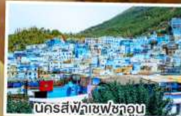
นครสีฟ้าชเฟซากูน