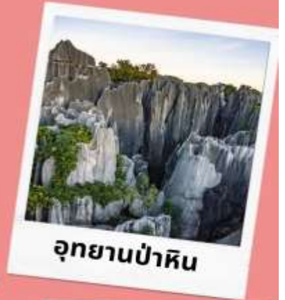
อุทยานป่าหิน