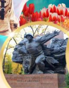
สวนสาธารณะพานฟิออฟ