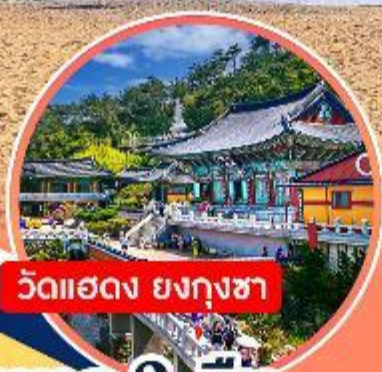
วัดแฮดง ยังกุงซา