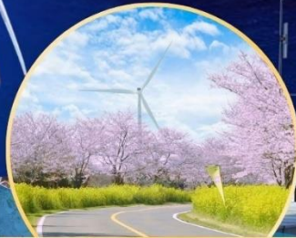
ซากระะ / ทุ่งดอกเรป