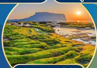
นาตดฮังช็ีที