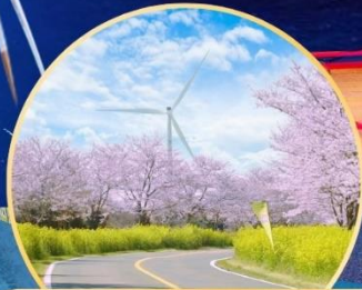
ซากระ / ทุ่งดอกเรป