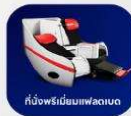
ที่นั่งพรีเมียมฟลายเบด