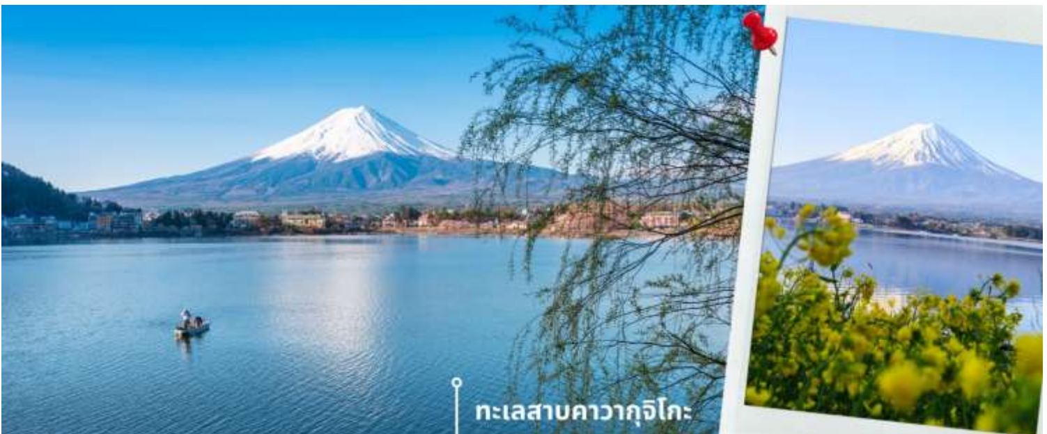
ทะเลสาบคาวากูจิโกะ

หลังรับประทานอาหารเช้า นำท่านแวะชม พิพิธภัณฑสถานแผ่นดินไหว เป็นพิพิธภัณฑสถานที่แสดงถึงผลกระทบจากภัยพิบัติแผ่นดินไหวและการระเบิดของภูเขาไฟ ภายในพิพิธภัณฑสถานมีห้องจัดแสดงข้อมูลการประทุของภูเขาไฟจากทุกมุมโลก โซนความรู้ต่างๆและโซนข้อปั้งสินค้าญี่ปุ่นอาทิเช่น ผลิตภัณฑ์เครื่องสำอางและของฝากอีกมากมาย พอสมควรแก่เวลานำท่านเดินทางสู่ ทะเลสาบคาวากูจิโกะ (Lake Kawaguchiko) ในจังหวัดยามานาชิ แหล่งท่องเที่ยวที่อยู่ไม่ไกลจากโตเกียว (Tokyo) หนึ่งในที่ที่เยวญี่ปุ่นยอดฮิตตลอดกาล ทะเลสาบที่กว้างใหญ่เป็นอันดับ 2 ของ 5 ทะเลสาบรอบภูเขาไฟฟูจิ อยู่บริเวณเชิงภูเขาไฟ ความสูงกว่าระดับน้ำทะเลประมาณ 800 เมตร ทำให้สภาพอากาศบริเวณนี้เย็นสบายตลอดปี รายล้อมไปด้วยธรรมชาติที่อุดมสมบูรณ์ และทิวทัศน์สวยงามตลอดปี ในช่วงเวลาที่พลาดไม่ได้เลยที่จะได้ชื่นชมดอกซากุระบาน คือในช่วงปลายเดือนมีนาคมจนถึงต้นเดือนเมษายน จะบานสะพรั่งสวยงามเรียงรายริมทะเลสาบ สามารถชมวิวดูทั้งทะเลสาบและภูเขาไฟฟูจิได้อย่างชัดเจน นับเป็นจุดชมซากุระยอดฮิตที่สุดอีกแห่งหนึ่งในญี่ปุ่น