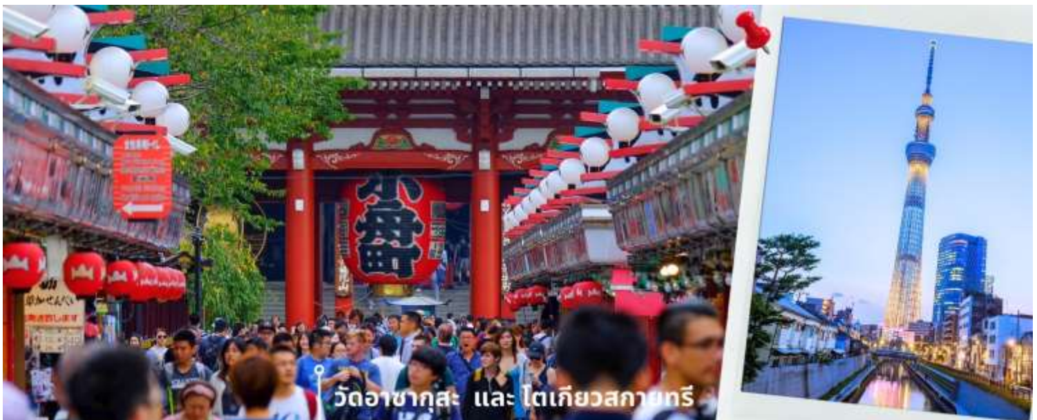
วัดอาซากุสะ และ โตเกียวสกายทรี

08.00 น. เดินทางถึงสนามบินนาริตะ ประเทศญี่ปุ่น หลังจากผ่านพิธีตรวจคนเข้าเมืองและศุลกากรแล้ว นำท่านขึ้นรถโค้ชปรับอากาศ จากนั้นเดินทางสู่ เมืองโตเกียว พาท่านสักการะ ที่ วัดอาซากุสะ (Asakusa Temple) วัดที่ได้ชื่อว่าเป็นวัดที่มีความศักดิ์สิทธิ์และได้รับความเคารพนับถือมากที่สุดแห่งหนึ่งในกรุงโตเกียวภายในประดิษฐานองค์