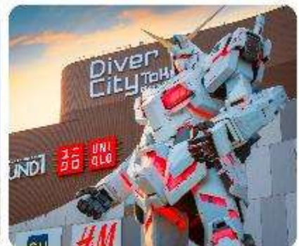
ย่านโอไดบะ ห้างไดเวอร์ซิตี ODAIBA SEASIDE PARK