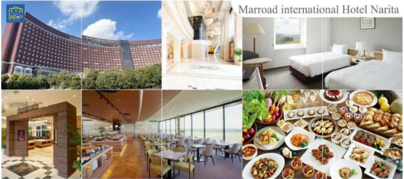
Marroad international Hotel Narita

วันที่หก ท่าอากาศยานนานาชาตินาริตะ – ท่าอากาศยานนานาชาติ ดอนเมือง