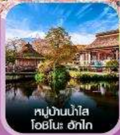
หมู่บ้านน้ำใส โอชิโนะ ฮักไก