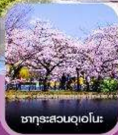
ซากุระสวนอุเอโนะ

คอนเพิร์มออกเดินทาง ทุกพีเรียด 2 ท่านขึ้นไป