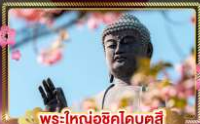
พระใหญ่อุซึคุโดบุคสี