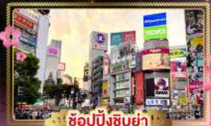
ช้อปปิ้งชิบูย่า