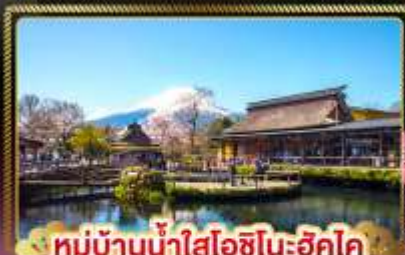
หมู่บ้านน้ำใสโอชิโนะฮักโค