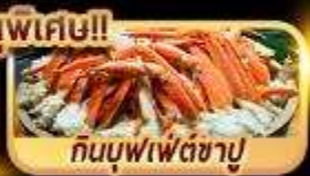
กินบุฟเฟ่ต์ซาซู