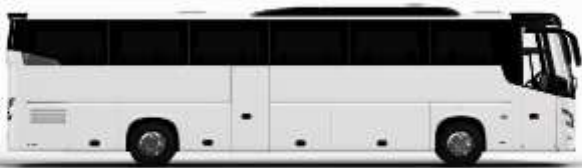
ตัวอย่างรถทัวร์ 1 คัน

ค่าที่พักตามที่ระบุในรายการหรือเทียบเท่าระดับเดียวกัน (พักห้องละ 2 ท่าน) หากประเภทห้องที่ท่านริเวสมาเป็นอีก เช่น ริเวสห้องพักเป็น TWIN BED หรือ DOUBLE BED ทางบริษัทขอสงวนสิทธิ์ในการปรับประเภทห้องพัก เป็นตามที่โรงแรมมีอยู่ โดยไม่ต้องแจ้งให้ทราบล่วงหน้า